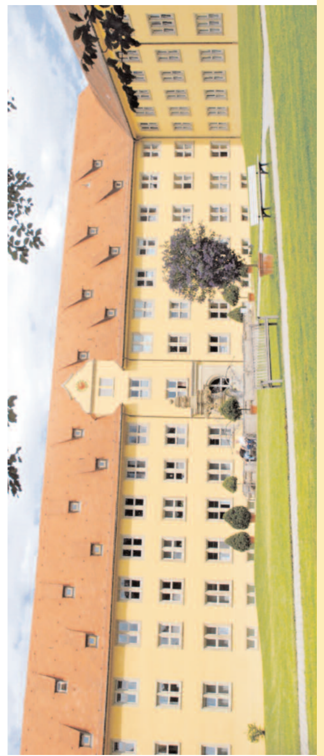
Klinikum Schloß Winnenden - 2010